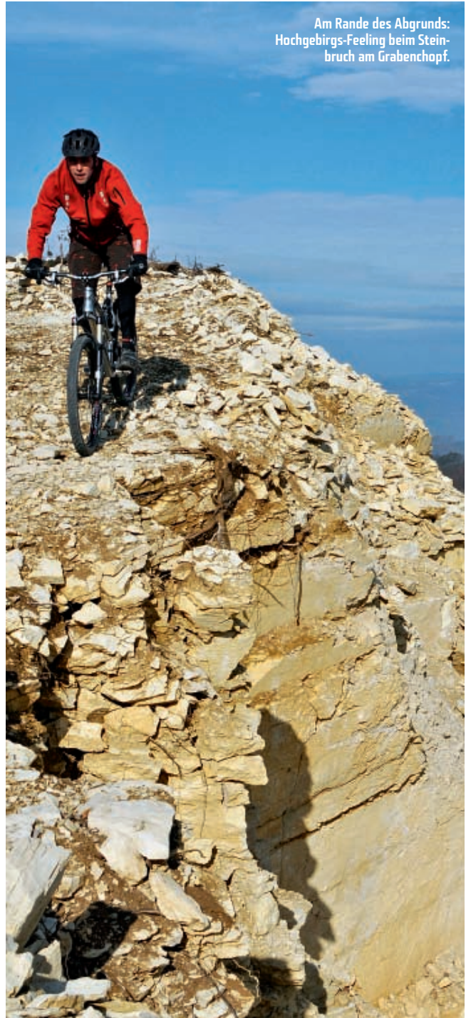
Am Rande des Abgrunds: Hochgebirgs-Feeling beim Steinbruch am Grabenchopf.

Beim nächsten Aussichtspunkt bei der Ruine Besserstein wird das Gelände rau mit bis zu 100 Prozent Gefälle. Mein erster Eindruck hat nicht getäuscht. Das Big Mountain kombiniert dank Mojo! das beste aus zwei Welten. Bergauf ist es angenehm zu fahren. Je steiler und schwieriger das Gelände bergab, desto offensichtlicher werden die Sicherheitsreserven von Fahrwerk, variabler Sitzposition und grossflächigen (Shimano XT-) Scheibenbremsen. Wir tauschen die Bikes erneut, justieren die Mojos auf Downhill (flacher Sitzwinkel) und lassen den Sattel mit einem Griff an der KindShock-Stütze in der Tiefe verschwinden. So schwindet auch der Respekt selbst vor ruppigsten Hindernissen und kleinen Drops. Wir kommen uns vor wie Kinder auf dem Spielplatz, die immer waghalsigere Experimente ausprobieren. Steile, verwinkelte Treppen? Kein Problem! Der Trail bleibt danach noch eine Weile stark abschüssig, ist weiter unten aber nicht mehr ganz so anspruchsvoll. Schon rückt der Schlossberg mit seinen Rebstöcken wieder ins Blickfeld. Zwei Stunden sind vergangen wie im Fluge. Schade, denn das hat richtig Spass gemacht. Die Tour ist zu Ende. Bleibt nur noch die bange Frage nach dem Preis des Bikes. «Knapp fünftausend Franken», sagt Stefan bedeutungsvoll. Der Wert des Fahrspasses? Unbezahlbar!