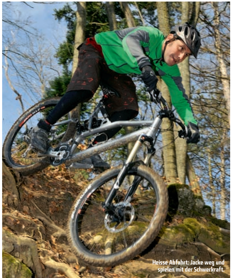
Heisse Abfahrt: Jacke weg und spielen mit der Schwerkraft.

nahezu antriebsneutral. Vor allem auf dem mittleren Kettenrad vorne ist beim Pedalieren praktisch kein Wippen zu spüren. Eine bemerkenswerte Eigenschaft, denn das RockShox Monarch RT3-Luftfederbein verwaltet üppige 16 Zentimeter Federweg, ohne dass es sich ganz blockieren lässt. Das Vorderrad, eingespannt in einer wuchtigen Marzocchi 55 Micro Titanium-Luftfedergabel mit stabiler 20-Millimeter-Steckachse, rollt weit vor mir, was ein gutmütiges Abfahrtsverhalten erwarten lässt.