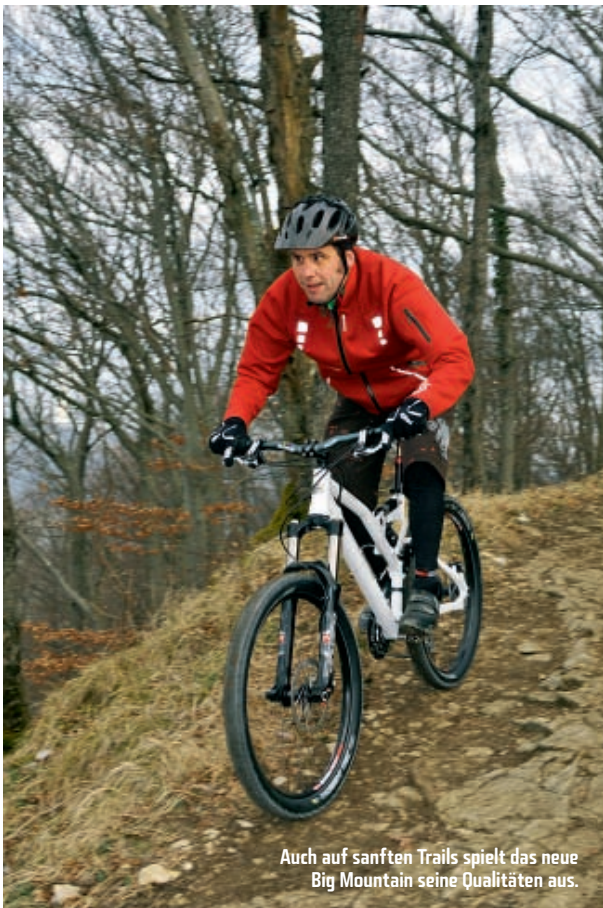
Auch auf sanften Trails spielt das neue Big Mountain seine Qualitäten aus.